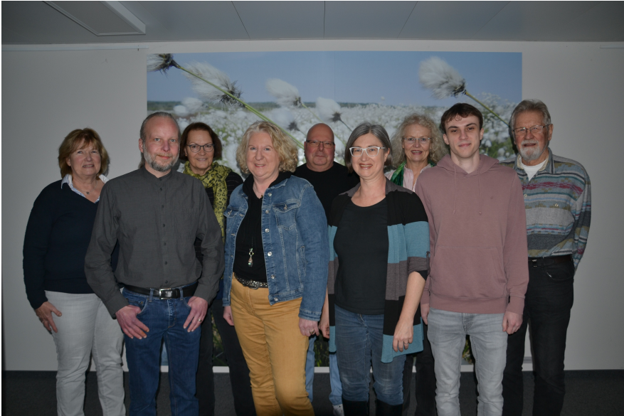
Unser Kandidat*innen Team